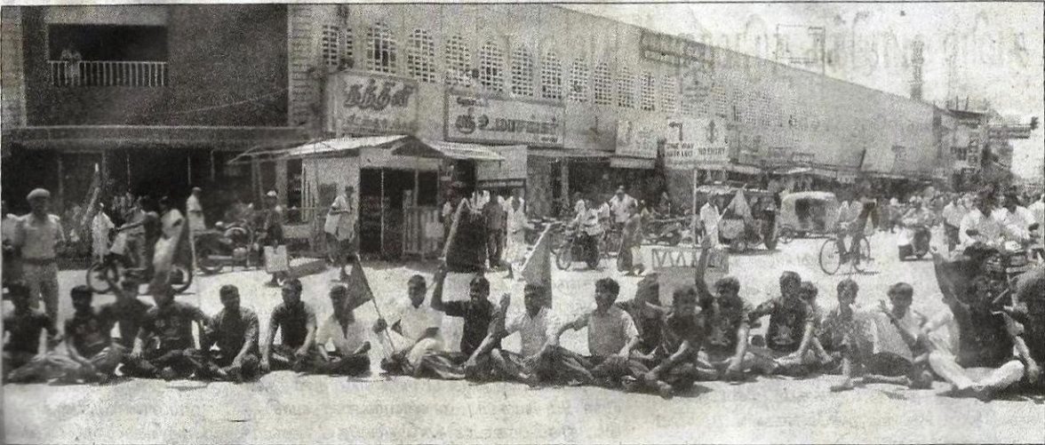
சங்கரன்கோவிலில் ஆதித்தமிழர் பேரவையின் சார்பில் திடீர் சாலை மறியல் போராட்டம் நடந்தது.